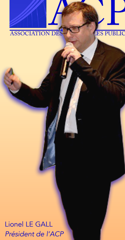
Lionel LE GALL Président de l'ACP